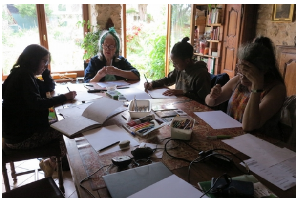
Atelier dessin en juillet, Post Art « noir et blanc »