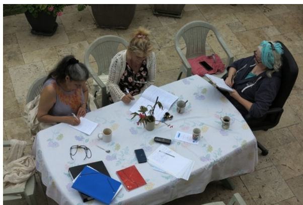
Atelier d'écriture août 2021