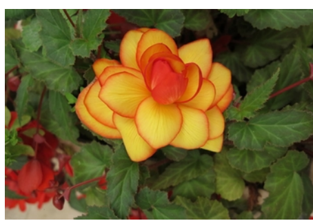
Atelier : Bouturer des bégonias

- Fête des 50 ans du Mouvement des RERS les 11, 12, 13 novembre à Strasbourg.